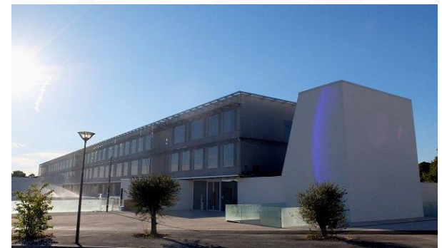
LMA at Château-Gombert Campus